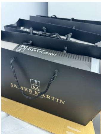
JMフレッシュサニタイザー ギフトセットC