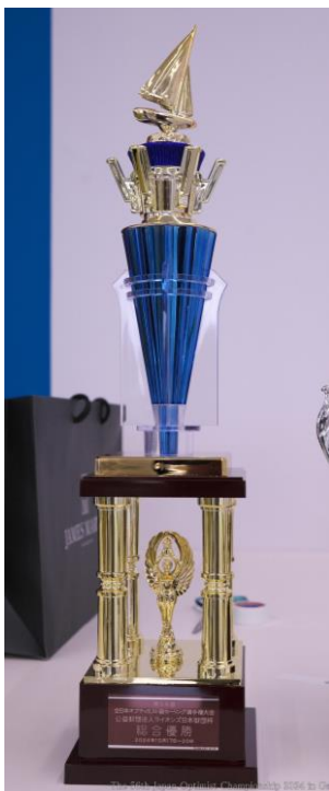
(財)ライオンズ日本財団杯