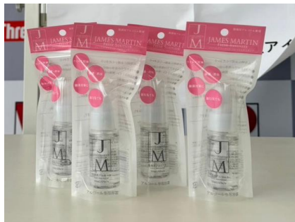
JMフレッシュサニタイザー