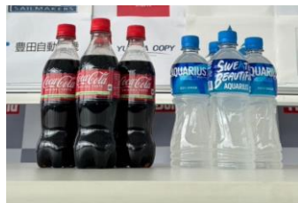
コカ・コーラ アクエリアス