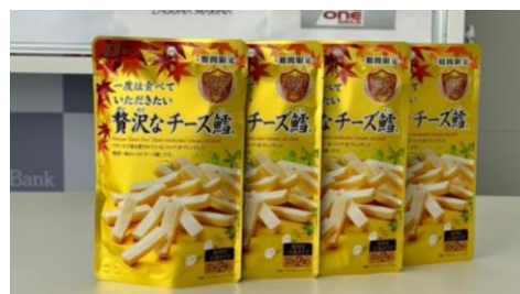
一度は食べていただきたい 贅沢なチーズ鱈