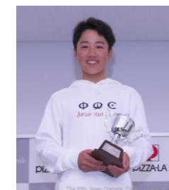
デンマーク農業理事会杯