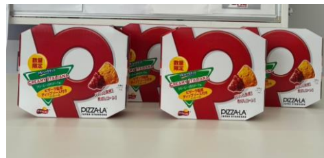
トルティーアチップス