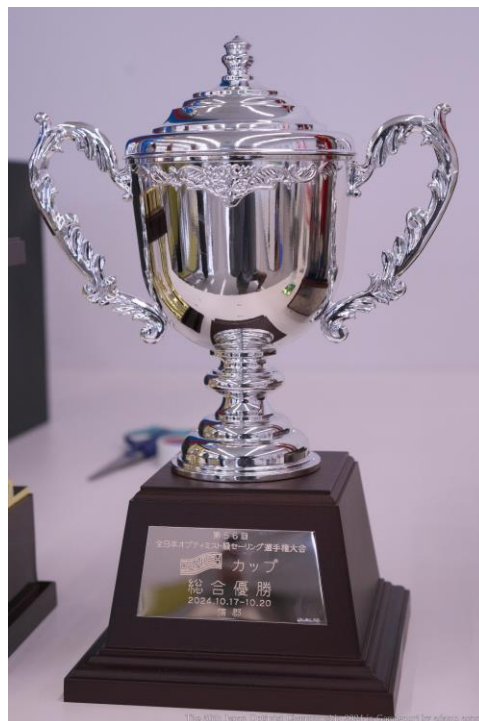
デンマーク農業理事会杯