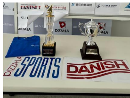
ステッカー (PIZZA-LASPORTS/DANISH) トロフィー