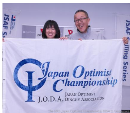
JODA旗が来年の主催クラブ 兵庫ジュニアヨットクラブへ 引き継がれました