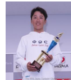
(財)ライオンズ日本財団杯