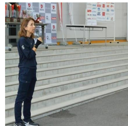
宇田川テクニカル委員長